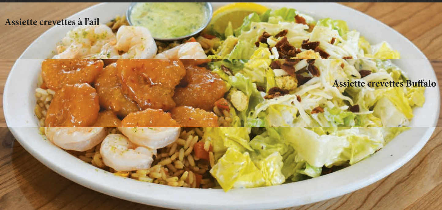
Assiette crevettes Buffalo